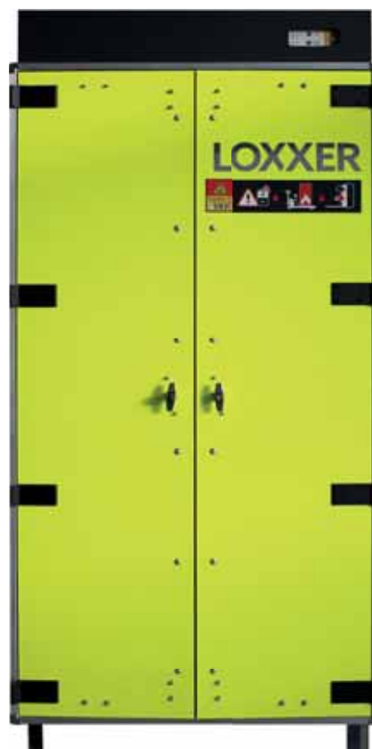
LOXX1850 - Loxxer 1850