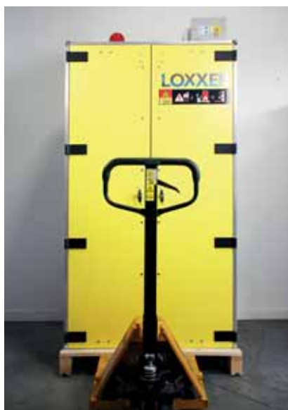
LOXK1850 - ľahká manipulácia, umiestnenie