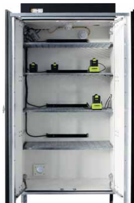
LOXK1850 - Loxxer 1850 interiér skrine